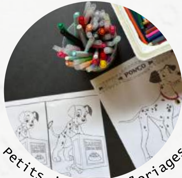
Petits jeux et coloriages