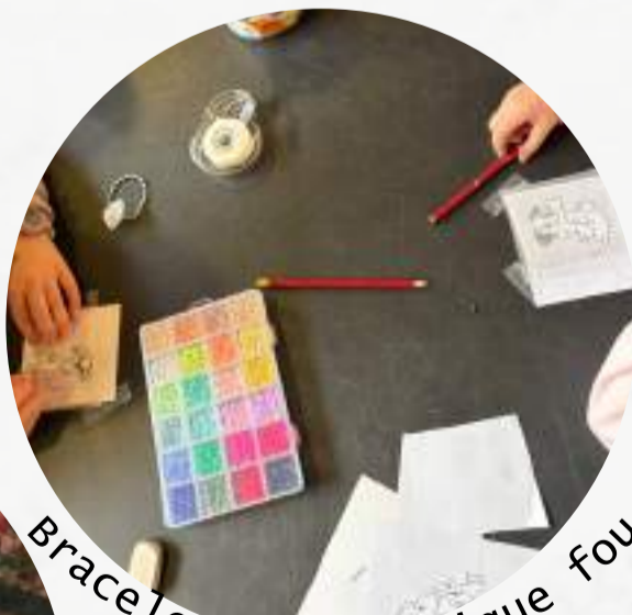
Bracelet et plastique fou