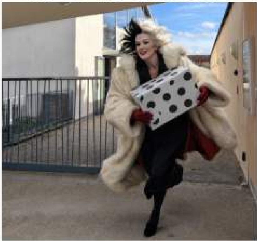
VOL DE CRUELLA

Les enfants sont partis à la recherche du goûter ! Pour cela plusieurs indices ont été placés dans Bessenay par l'aide des dalmatiens. Car Cruella a volé le goûter des enfants et l'a remplacé par du gâteau à la carotte et à la betterave ! Les enfants ont pu trouver la boîte qui contenait le goûter caché à l'école.