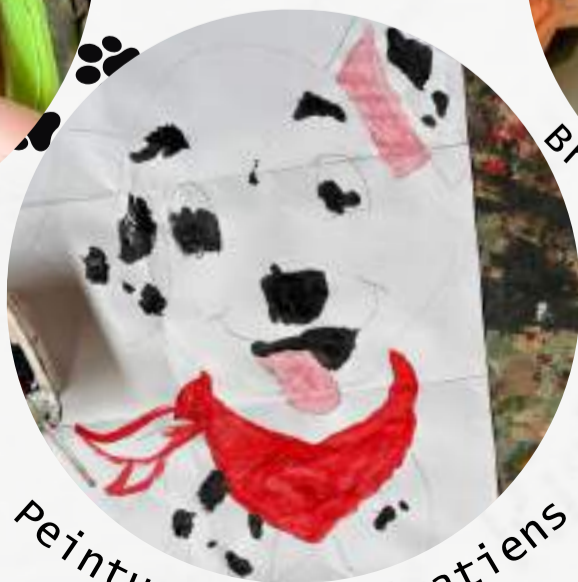
Peinture des dalmatiens