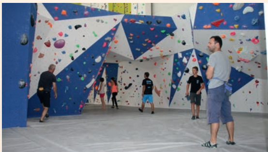
L'escalade et les JO